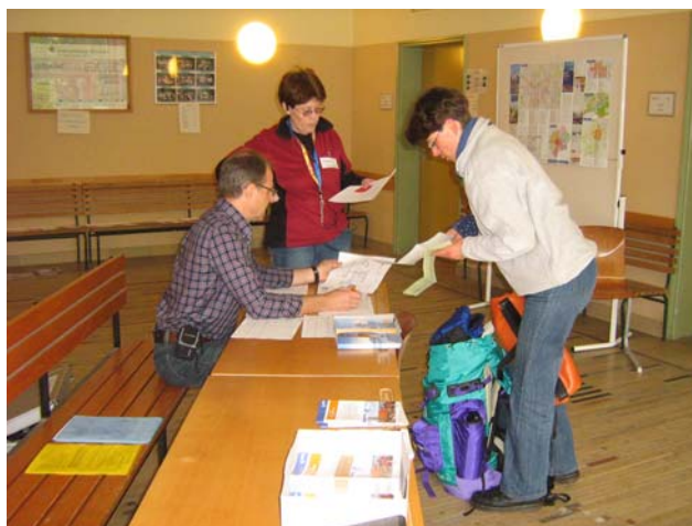
Einchecken der Besucher an der „Rezeption Hotel Sitalischule

Unsere Gäste waren überwiegend junge Leute, wenngleich auch einige wenige Personen in höherem Alter das Gemeinschaftsquartier nutzten. Vielfach waren für die Anreise Bahn und Bus verwendet worden. Die Gäste gehörten – soweit erkennbar – überwiegend evangelischen Kirchengemeinden an. Ganz im Sinne der Ökumene: Die katholische Pfarrei St. Albert als Gastgeber für evangelische Mitchristen.