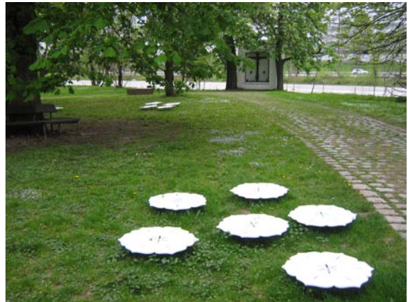
Verschiedene Blüten auf eine Wiese gestreut symbolisieren Auflösung, Hoffnung und Frieden